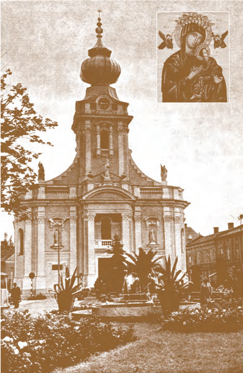
“...le soste davanti all’immagine della Madre del Perpetuo Soccorso”. Wadowice, Chiesa parrocchiale, ora basilica.