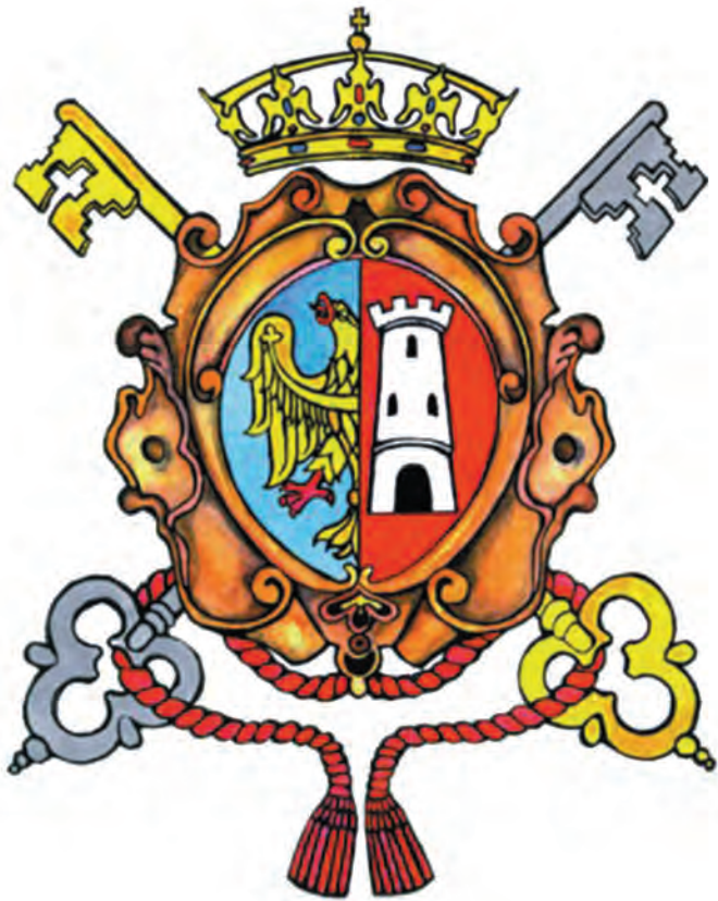
Lo stemma di Wadowice, paese nativo di Karol Wojtyła.